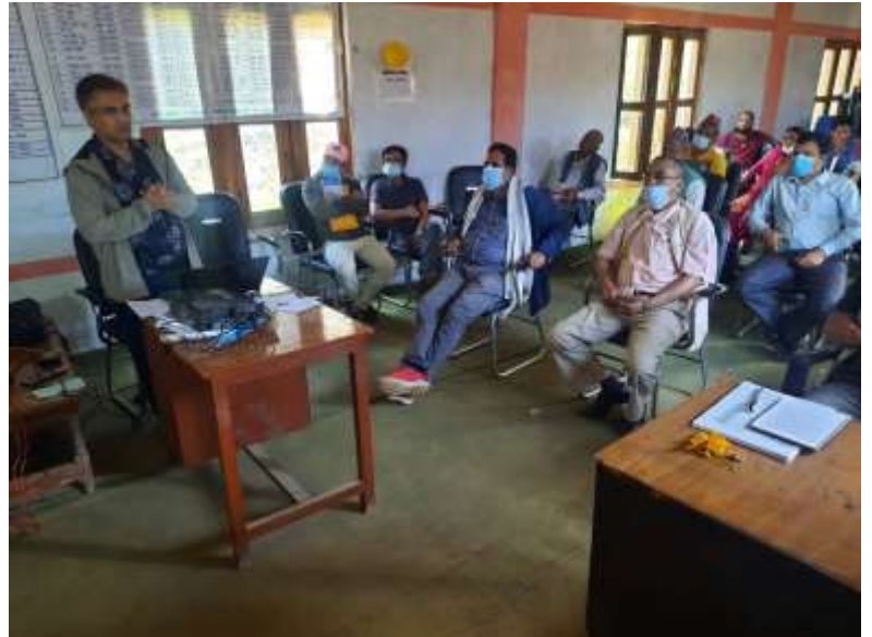
चित्र 1: कार्यशालामा परामर्श टोलीको छलफलको झलक

राजस्व सुधार कार्ययोजना तर्जुमाको लागि परामर्शदाताको टोली २०७८/०३/१० गते मेलौली नगरपालिकाको कार्यालयमा पुगी नगरपालिकाका प्रमुख प्रशासकिय अधिकृत तथा राजस्व शाखा प्रमुखसंग प्रारम्भिक बैठक गरी अभिमुखीकरण कार्यशालाको मिति, समय, सहभागि र छलफलका विषयबस्तुहरू तय गरीएको थियो । यसै गरी पुर्व तालिका अनिरूप २०७८/०३/१२ गते का दिन स्थानीय तहको राजस्व परिचालन