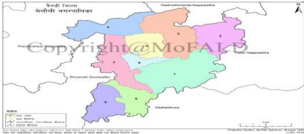
मेलौली नगरपालिकाको नक्शा

नेपाल सरकारको मिति २०७३ फाल्गुन २२ गतेको निर्णय अनुसार प्रारम्भमा साविकका मेलौली, महारुद्र, विशालपुर, दुर्गास्थान (१,२,३,८ र ९ वडाहरू), सलेना, शिवनाथ(६,७, ८ र ९ वडाहरू), रोडिदेवल(४,५,६ र ७ वडाहरू), गा.वि.स.हरू समाबेस गरी मेलौली नगरपालिका घोषणा भएको थियो । नेपालको संविधान, २०७२ लागू भए संगै स्थानीय तहहरू निर्माण गर्ने क्रममा नेपाल सरकारकै मिति २०७३ फागुन २७ गतेको राजपत्रमा प्रकाशित सूचना अनुसार मेलौली नगरपालिकाको क्षेत्र विस्तार गरिएको छ । नेपालको संविधान २०७२ अनुसार सुदूरपश्चिम प्रदेश अन्तर्गत पर्ने यो नगर बैतडी जिल्ला का ४ वटा नगरपालिका सहित चौथो नगरपालिका हो । बैतडी जिल्लाको दक्षिण—पश्चिम भागमा पर्ने यो नगरपालिकाको केन्द्र मेलौली बजार जिल्ला सदरमुकाम बैतडीबाट करिब ३५ किलोमिटर को दुरीमा पर्छ । नयाँ संरचना अनुसार यस नगरपालिकामा ९ वटा वडाहरू रहेका छन् । वि.सं. २०६८ को जनगणना अनुसार यस नगरपालिकामा ३९,३४ घरपरिवार वसोवास गर्दछन् । नगरपालिकाको को कुल जनसंख्या २२,५४५ रहेको छ । जसमा पुरुषको संख्या १२,१११ र महिलाको जनसंख्या १०,४३४ रहेको छ।