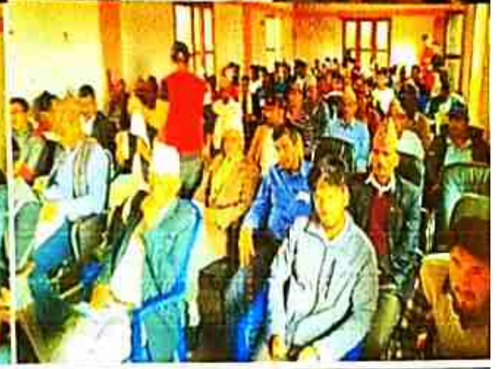
कार्यक्रममा उपस्थित मेवाघाटि, एवम् सरोकारवालाहरू