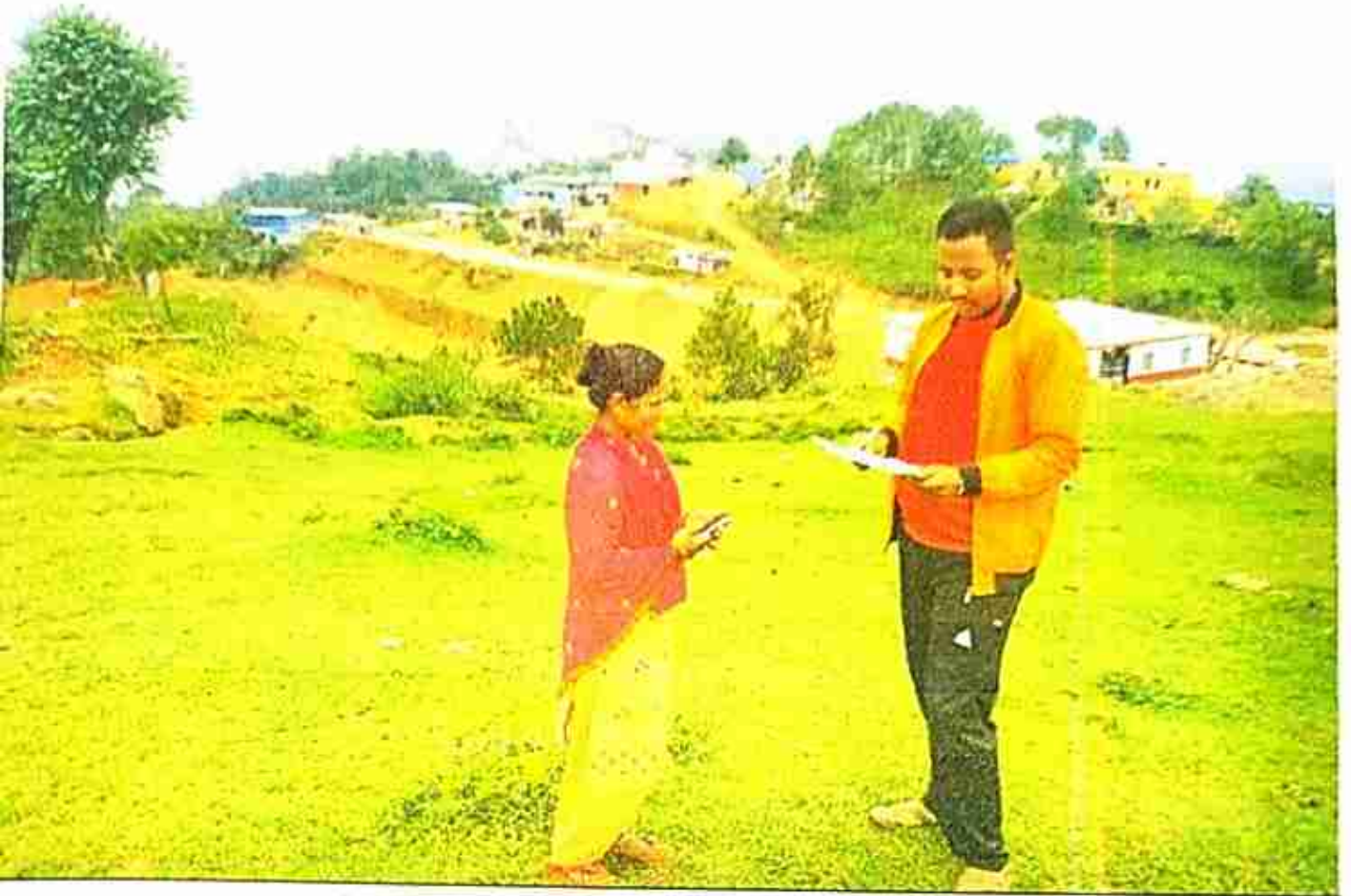
नागरिक प्रतिवेदन र बाहिर्गमन पत्र संकलनगर्दै नेपालपत्रकार महासंघका प्रतिनिधि